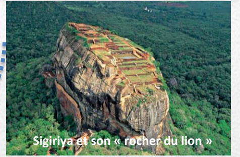
Sigiriya et son « rocher du lion »