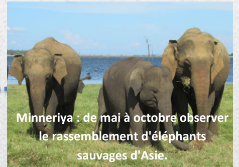
Minneriya : de mai à octobre observer le rassemblement d'éléphants sauvages d'Asie.