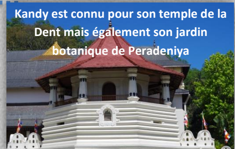
Kandy est connu pour son temple de la Dent mais également son jardin botanique de Peradeniya