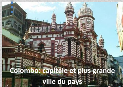
Colombo: capitale et plus grande ville du pays