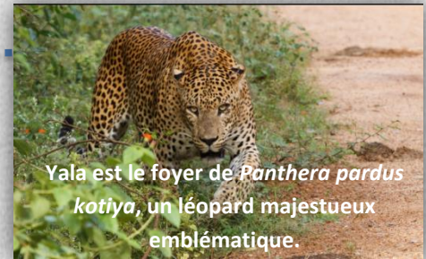
Yala est le foyer de Panthera pardus kotiya , un léopard majestueux emblématique.