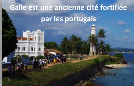
Galle est une ancienne cité fortifiée par les portugais