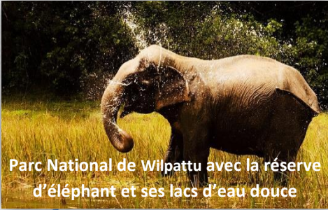
Parc National de Wilpattu avec la réserve d'éléphant et ses lacs d'eau douce