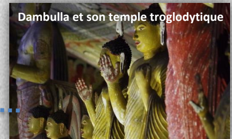
Dambulla et son temple troglodytique